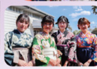
2年間ホントに 楽しかったあ〜