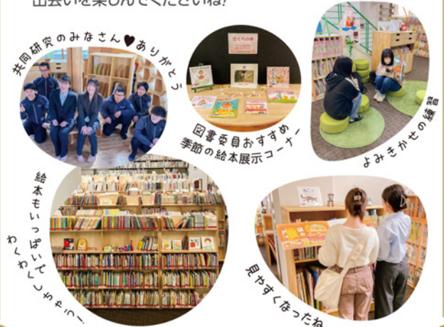
共同研究のみなさん♡ありがとう

図書館のリニューアル工事に伴い、 ものづくり大学と本学の共同研究による 図書館家具製作も並行して行われ、 その完成披露会の模様がテレビ埼玉で放映されました。 木の温もりを感じられる新しい図書館で、素敵な本との 出会いを楽しんでくださいね！