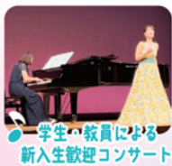
学生・教員による 新入生歓迎コンサート