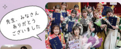
先生、みなさん ありがとうございました