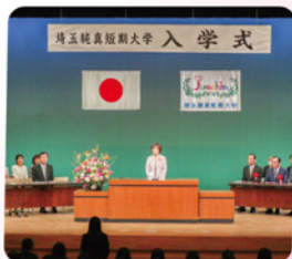
新入生代表あいさつ