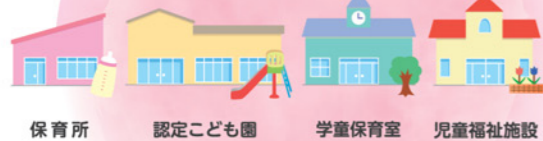
保育所 認定こども園 学童保育室 児童福祉施設 など