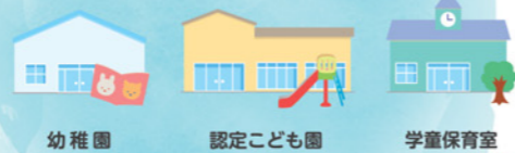
幼稚園 認定こども園 学童保育室 など