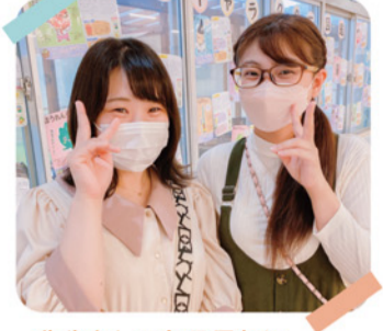
先生として毎日元気に頑張っています！