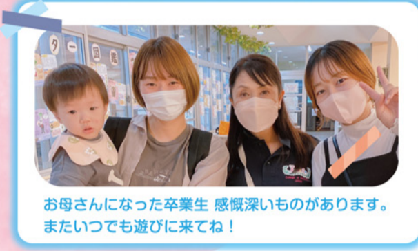
お母さんになった卒業生 感慨深いものがあります。またいつでも遊びに来てね！