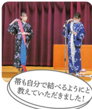
帯も自分で結べるようにと教えていただきました!