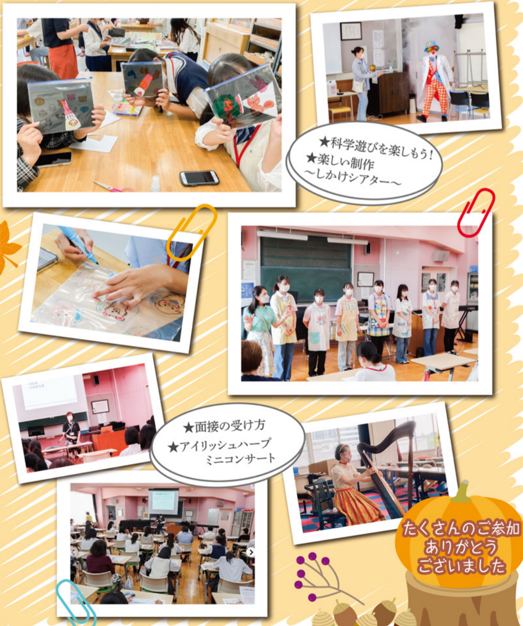
★科学遊びを楽しもう！ ★楽しい制作～しかけシアター～