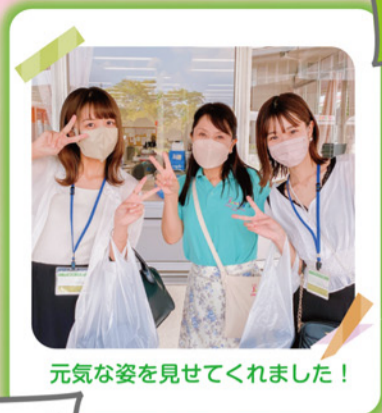
元気な姿を見せてくれました！